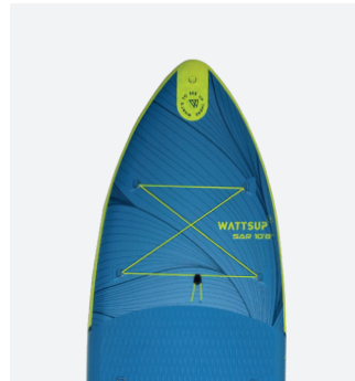
Shape optimisée pour la glisse