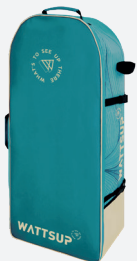
Sac de transport ultra-confort