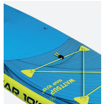
Élastiques de chargement & tapis EVA anti-dérapant