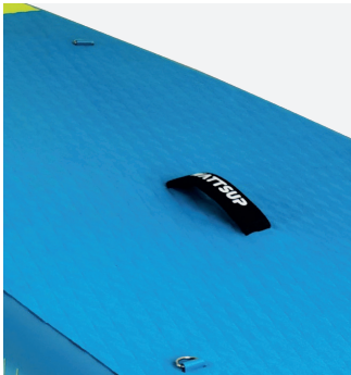
Poignées de transport ultra-confort en néoprène

Conçu pour supporter jusqu'à 145 kg, le Sar offre une stabilité exceptionnelle, ce qui en fait le choix parfait pour les débutants ou ceux qui recherchent une expérience sécurisée, même dans des eaux légèrement agitées. Grâce à sa taille compacte, il est très maniable et réactif, vous permettant de naviguer en toute confiance et avec aisance. Léger et facile à transporter, le Sar se gonfle rapidement pour des sorties spontanées où que vous soyez, vous offrant un accès immédiat à vos aventures aquatiques.